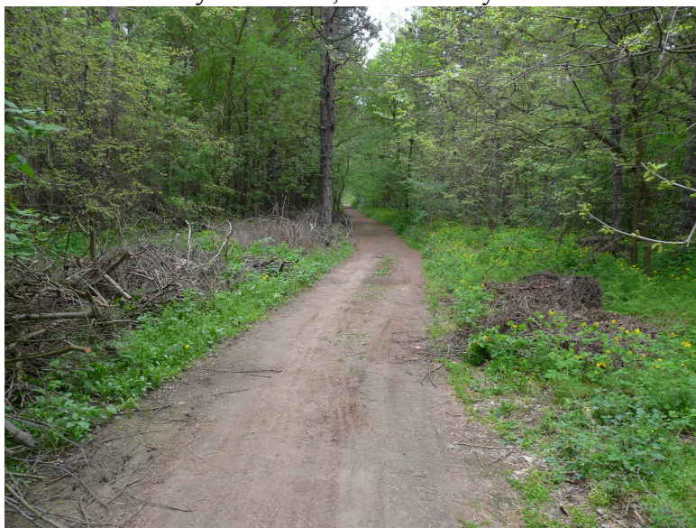
Nyomvonal 5,7 km-nél DK-ról