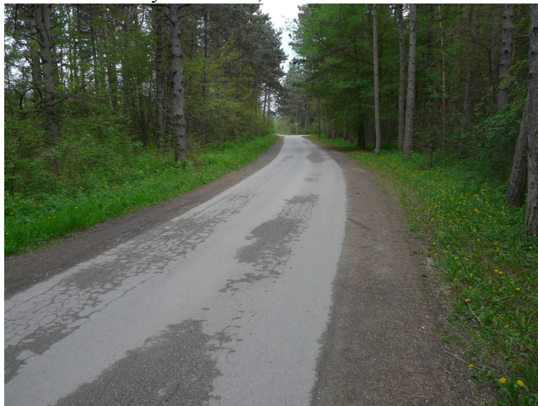
Nyomvonal 5,3 km-nél Ény-ról