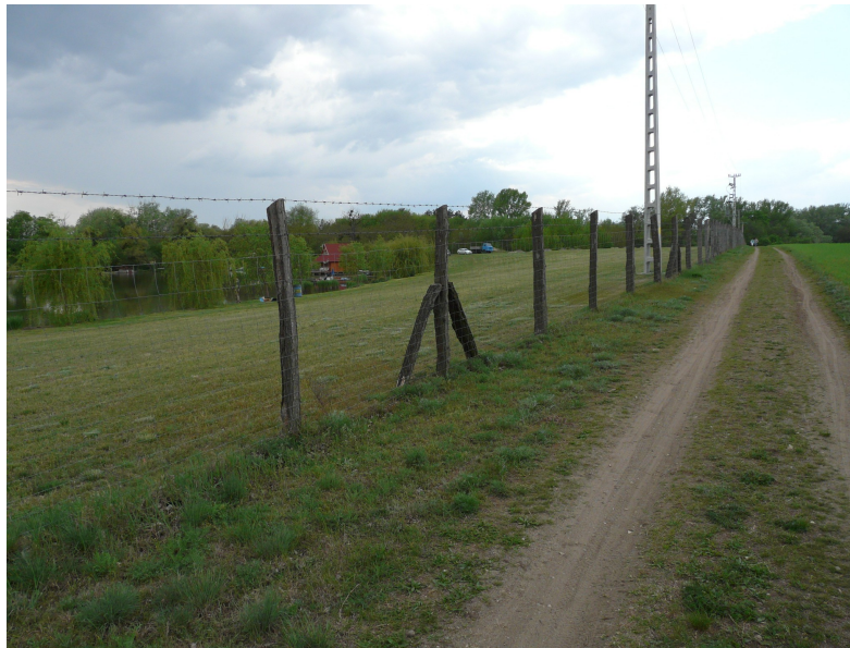
A lelőhely DK-ről