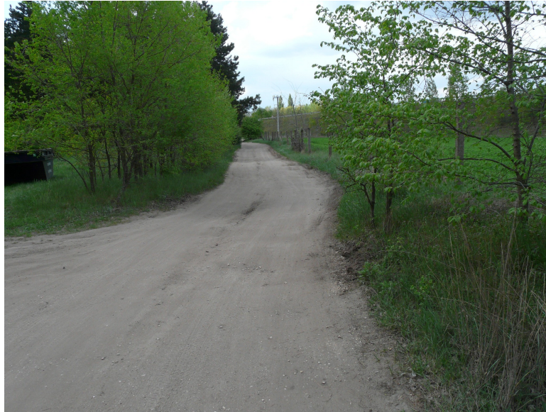
Nyomvonal 5,1 km-nél DK-ról