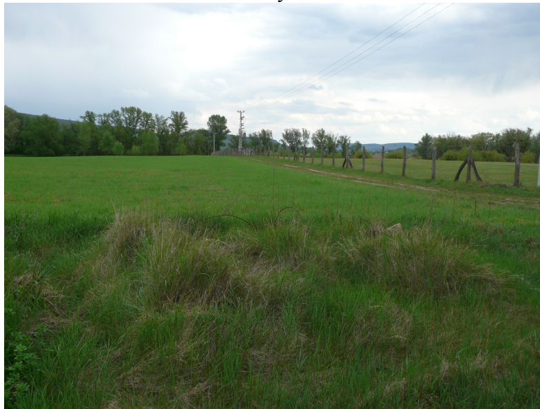
A lelőhely Ény-ről