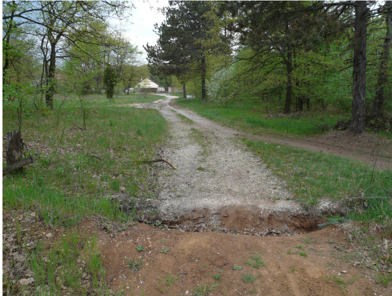
Nyomvonal 6,2 km-nél